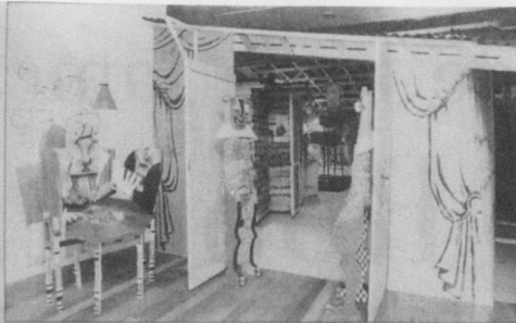
En el campo de la escultura maravilló la retrospectiva de Francisca Núñez.