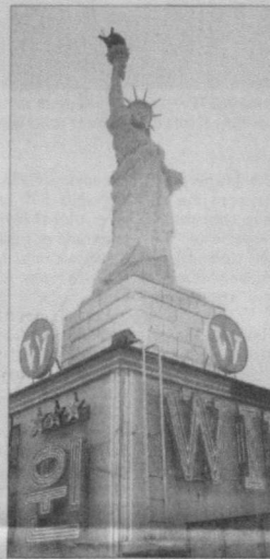
Valiosa visita la de arte coreano en el Museo de Arte Contemporáneo.