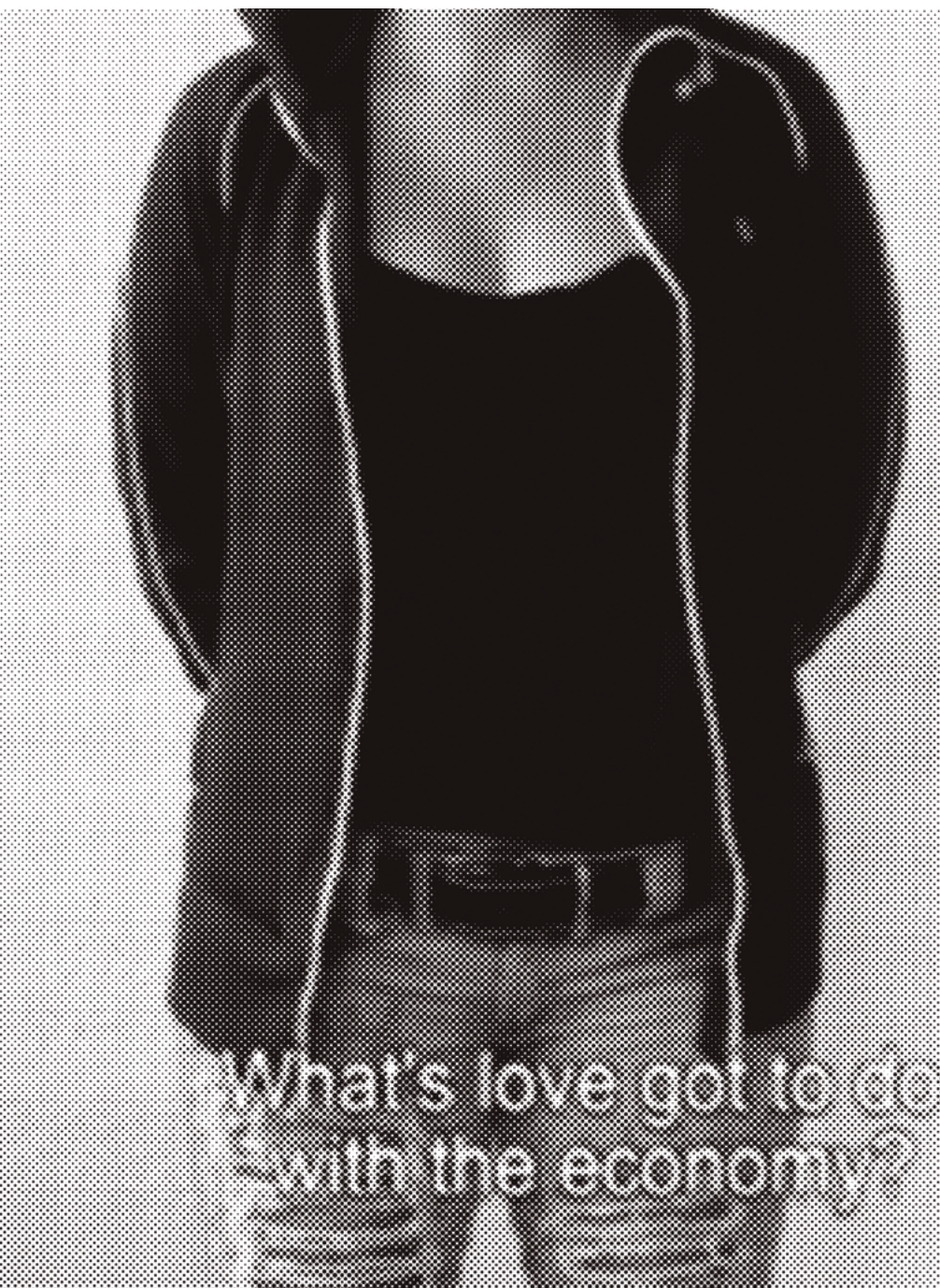
Los Invisibles. 2007