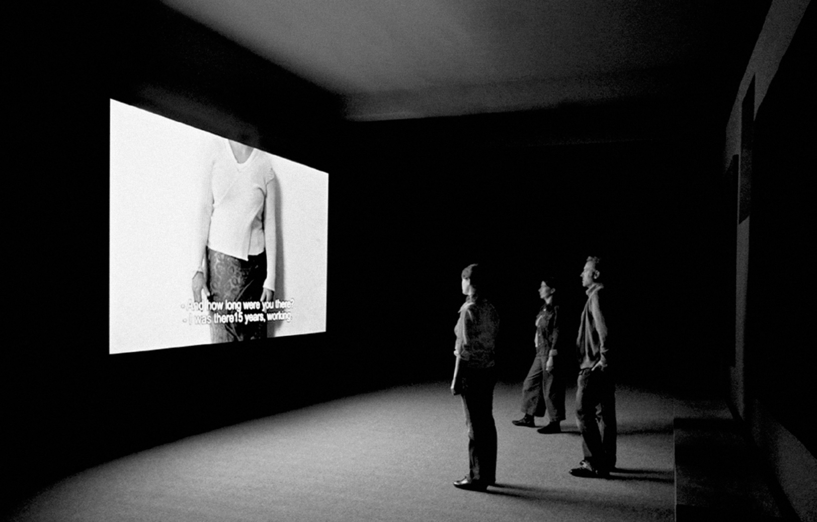
Los Invisibles. Galería Gabriela Mistral, Santiago, 2007

nueva suavidad es el acontecimiento, es el surgimiento de algo que se produce que no es yo; que no es el otro, que es el surgimiento de un foco enunciativo.